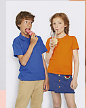
SOL'S MILO KIDS 02078