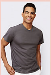
SOL'S VICTORY 11150