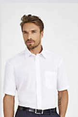
SOL'S BRISTOL 16050